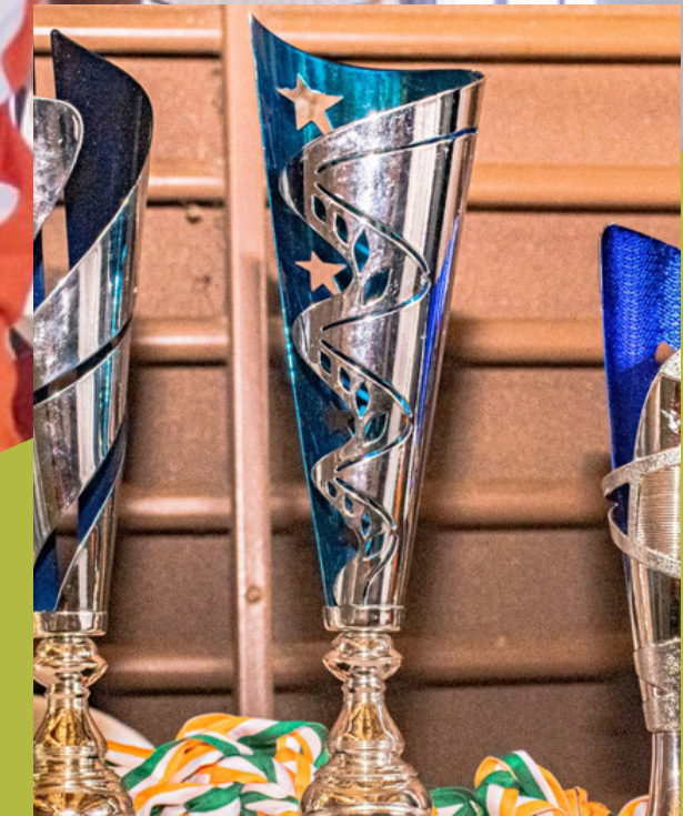
3 COMPETITIONS SCOLAIRES ET UNIVERSITAIRES