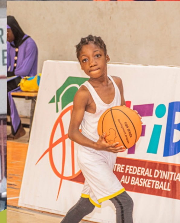
2 CHAMPIONNATS JEUNE DYNAMIQUE ET NATIONAL