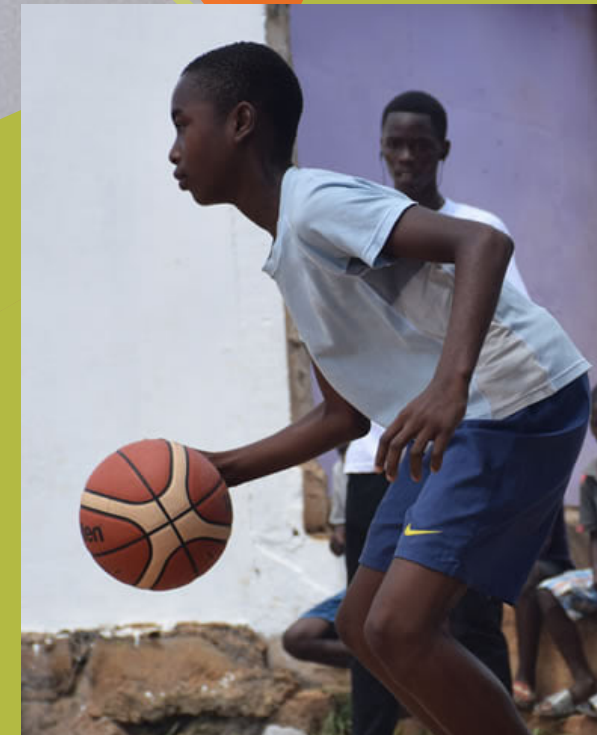
4 TOURNOIS INTERNATIONAUX JEUNES