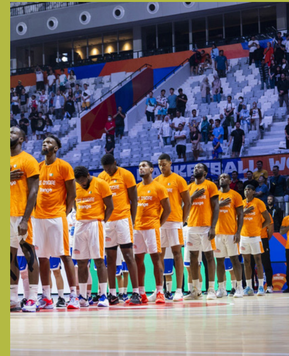
5 COMPETITIONS SENIORS FIBA ET BAL