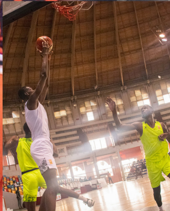
1 LIGUE CHAMPIONNATS SENIORS PROFESSIONNEL ET SEMI-PROFESSIONNEL